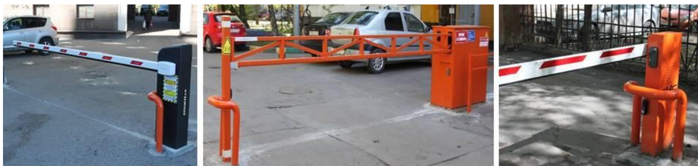
Фото 1 - ул. Дубровская 18 - шлагбаум Doorhan Barrier с защитой и Диспетчеризацией

Фото 2 - ул. Зеленодольская д.7 - Антивандальный шлагбаум сварной с защитой и Диспетчеризацией